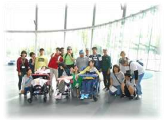
スマップ班：日本科学館(雨天)