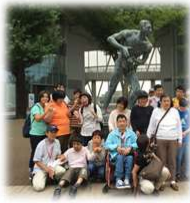
パリパリ班：日体大(雨天)