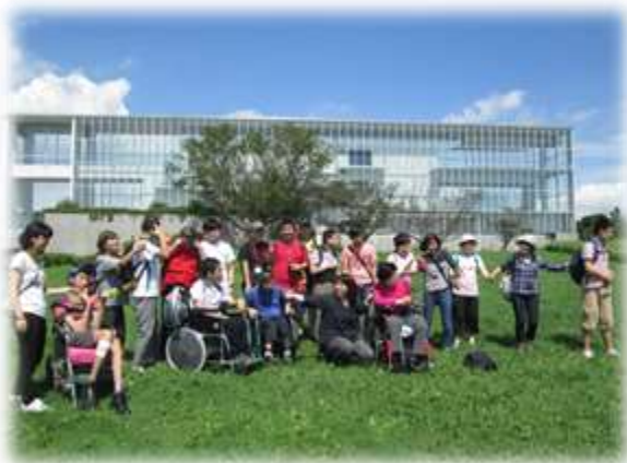
ミリオン班：葛西臨海公園

9月11日(金)、9月18日(金)、9月25日(金)、各生活班に分かれてピクニック外出を実施しました。